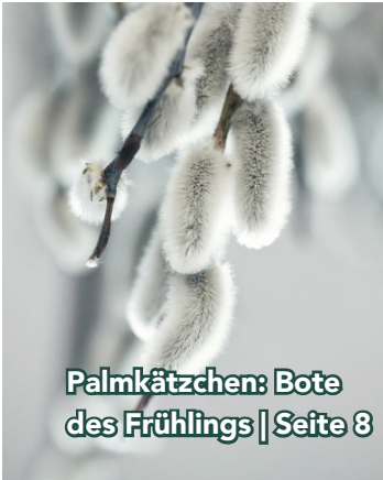
Palmkätzchen: Bote des Frühlings | Seite 8