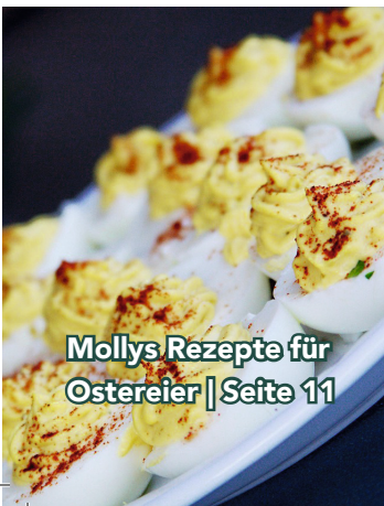
Mollys Rezepte für Ostereier | Seite 11