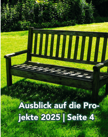
Ausblick auf die Projekte 2025 | Seite 4